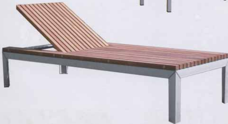
Sonnenliege mit verstellbarem Kopfteil. 200 x 80 x 45 cm.