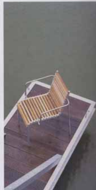
Für die Holzauflege wird Jatoba verwen- det, ein brasiliani- sches Hartholz.

■ Depuis la commercialisation de 'extempore' il y a deux ans, le programme intemporel de meubles de jardin a été progressivement complété. La conception modulaire permet d'offrir une gamme importante de bancs et de tables dont la base constructive est constituée par des profilés extrudés d'aluminium. Les piètements sont démontables, les composants des angles et les embouts des pieds sont en plastique, les raccords sont en acier spécial. Les panneaux sont réalisés en jatoba, un bois dur brésilien qui résiste aux intempéries et qui non seulement vieillit en se patinant d'un gris argenté raffiné, mais qui atteint aussi une longueur supérieure aux normes normales de manière qu'il possible de réaliser des modèles de jusqu'à 270 cm de longueur. Une table pour barbecue, des chaises, un fauteuil et un pouf complètent le programme.