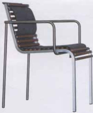
Stapelfähiger Armlehnstuhl mit optionaler Filzauflage. 58 x 56 x 78 cm.